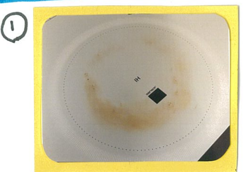
① IHのガラス面がこげ付きなどで汚れてしまっています。