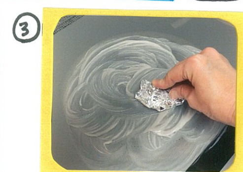
③ アルミホイルかラップを丸めたものでこすります。汚れたら新しいものに交換してくり返します。