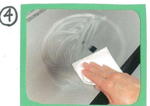
④ こすり終わったら布巾やキッチンペーパーでふきとって...