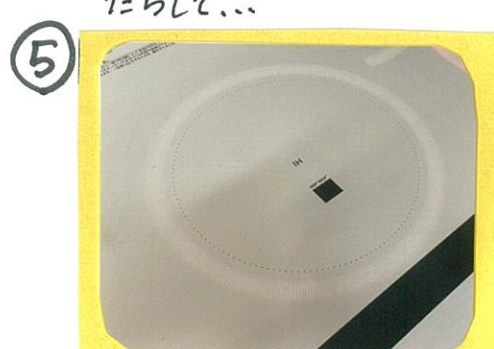
⑤ あーら!! ヒョカヒョカになりました