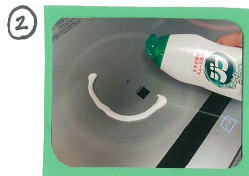
② この汚れの上にクリーンクレンザー(私はジウを使っています)をたら〜とたらして...