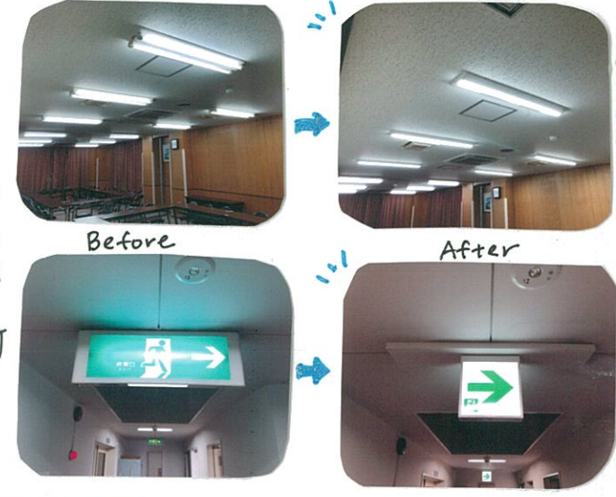
照明はLEDへと変化しています！！

この秋、下小口学共のお部屋の照明も非難難口誘導灯など全館、蛍光灯からLEDへお取り替えさせていただきました。LEDは省エネですので電気代も減りますね。地域の皆さまが集う場所のお手伝いがかさ喜ばしいです。